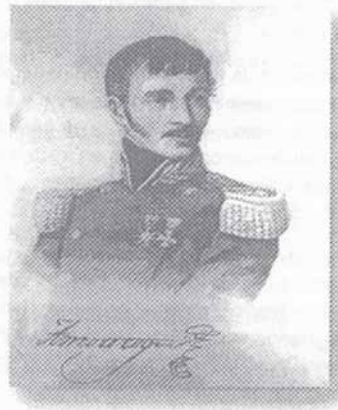
Red de museos de Norte de Santander – Museo Casa Anzoátegui

En la galería del más ilustre procerato colombiano José Antonio Anzoátegui no ha ocupado el sitio que corresponde a la trascendencia de su aporte a nuestra independencia ni a la heroicidad de su corta existencia patriótica.